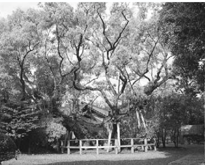
左：清盛楠(外宮) 下：清盛堤ゆかりの碑 (山田上り駅前)